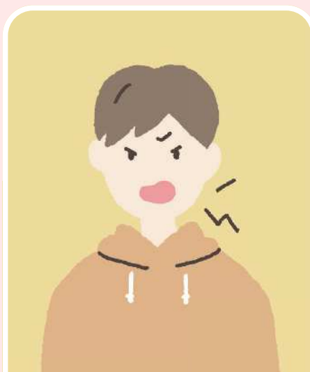
怒りやすくなった